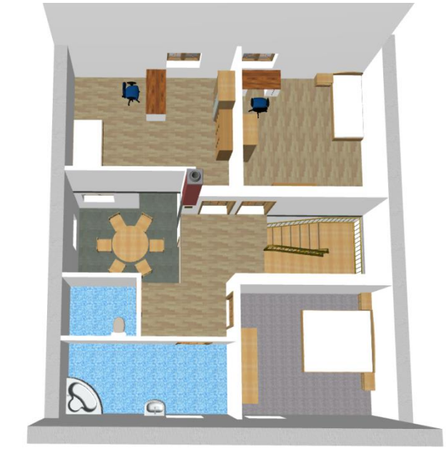
Pohled na druhé nadzemní podlaží