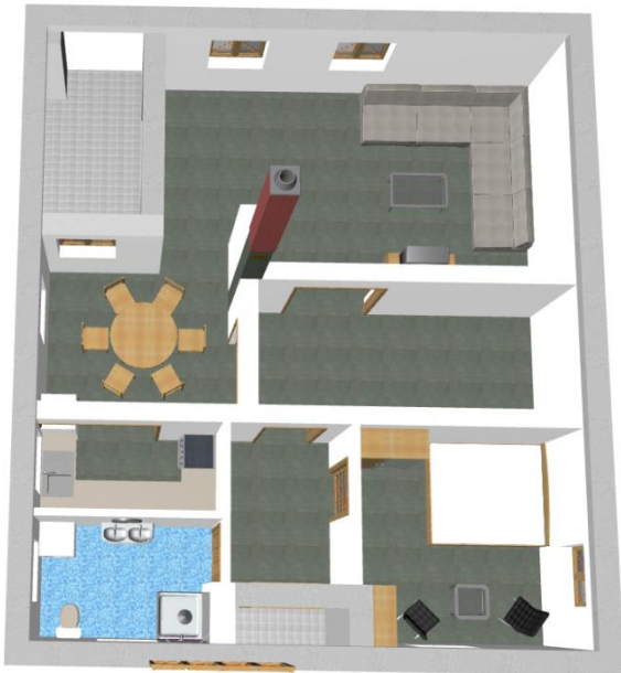
Pohled na první nadzemní podlaží