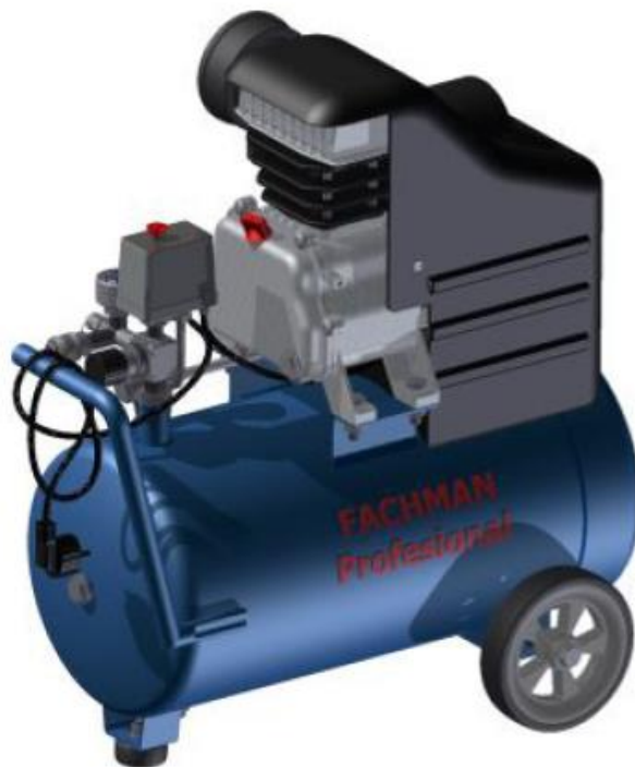
Obr. 1: celkový pohled

Tato práce se zabývá problematikou kompresorů, novými typy strojů a vylepšováním jejich konstrukce, což vede ke zdokonalování jejich energetických parametrů a smysluplnému využívání přiváděné energie..