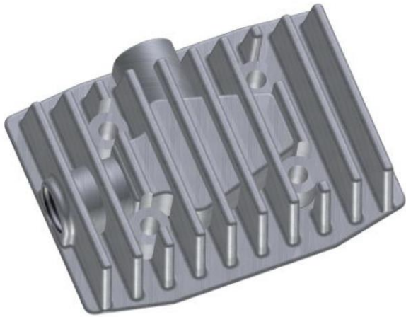
Obr. 2: hlava válce