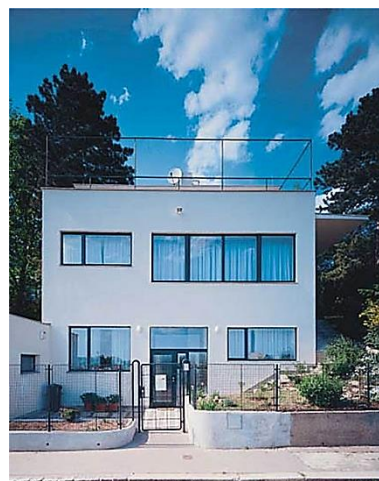
V Dům Janák po roce 1998, čelní pohled

Pavel Janák si dům sám projektoval a vybíral ze tří variant. Vybral si tu nejskromnější, prostý bílý kubus, členěný pouze okny a dveřmi, s odsazeným horním patrem, čímž se mu naskytl prostor pro terasu.