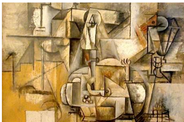
I Pablo Picasso - Le pigeon aux petits pois

Žil mezi lety 1882 a 1956 převážně v Praze. Byl to velmi nadaný student, už při studiích v ČR předčil mnoho zkušených renomovaných architektů, a proto šel za studiemi do Vídně k v té době nejzkušenějšímu a názorově nejvýbojnějšímu architektovi Ottu Wangerovi, kde studoval po dobu tří let. Inspiroval se Picassovým a Bracqueovým malířským kubismem. Ti ve svých dílech