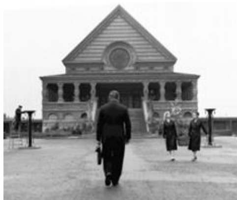
III Pardubické krematorium