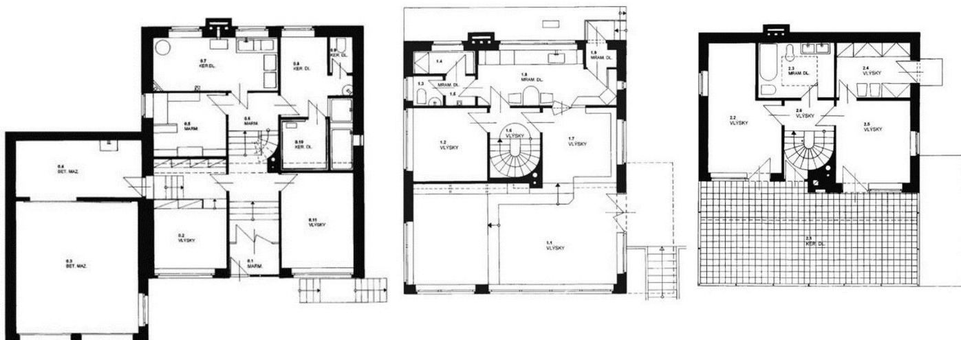
VII Půdorysy po rekonstrukci v roce 1998

z rekonstrukce v sedmdesátých letech ponechal, je přístavba garáže. Při těchto úpravách byly zjištěny zásadní technické nedostatky (např. chybějící zábradlí na schodišti, odkryté rozvody kanalizace a vody, které bránili vysazení oken atd.).