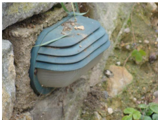
IX Původní domovní zvonek

A tady jsou detaily, které se některým majitelům podařily zachovat.