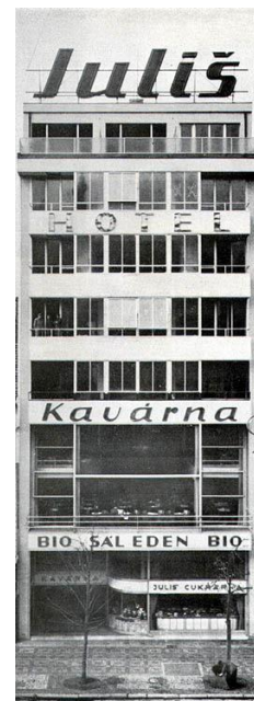
IV Hotel Juliš