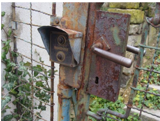
Některé stavební prvky jedné z vil.