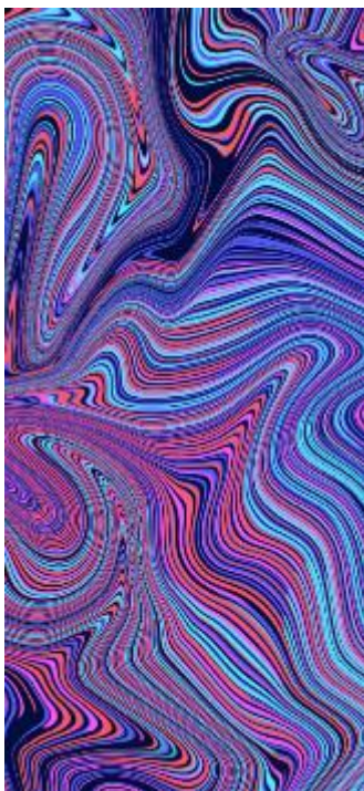
Obr 4 - Design Halucinace