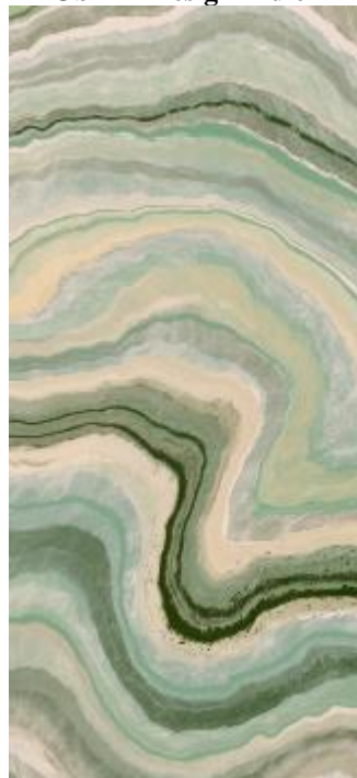
Obr 5 - Design Green mramor