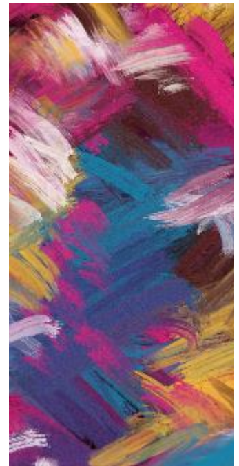
Obr 3 - Design Painting