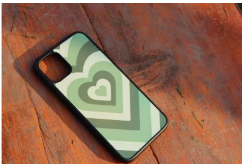
Obr 8 - Potisk Green Heart

V současnou chvíli jsme schopni vyrobit najednou 4 kryty s různými potisky. Celý proces od tisku, zatavení až po nasazení do krytu zabere přibližně 11 minut.