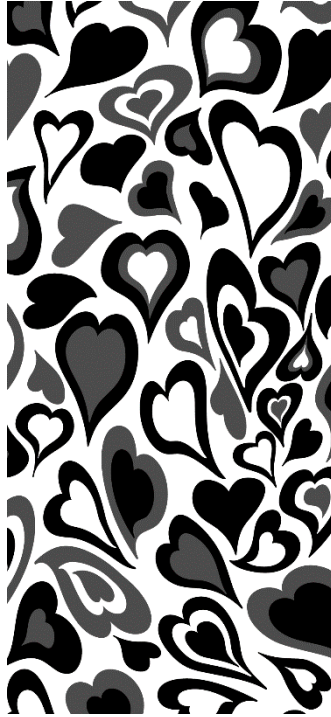
Obr 7 - Design BW srdíčka