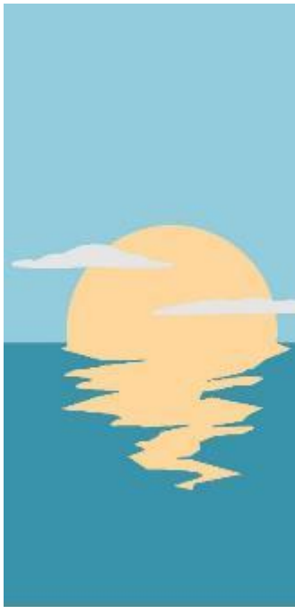
Obr 1 - Design Západ