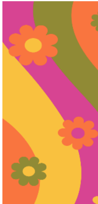
Obr 2 - Design Indie