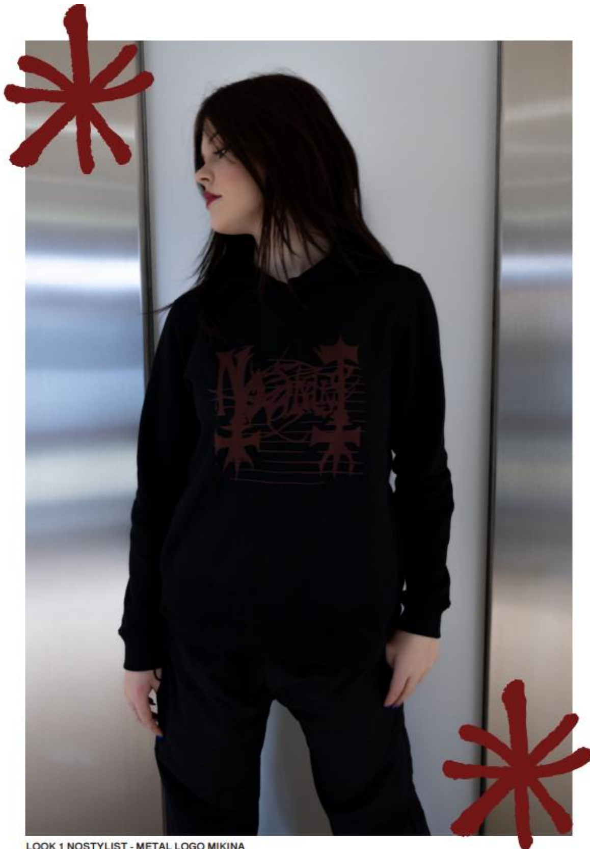
LOOK 1 NOSTYLIST - METAL LOGO MIKINA