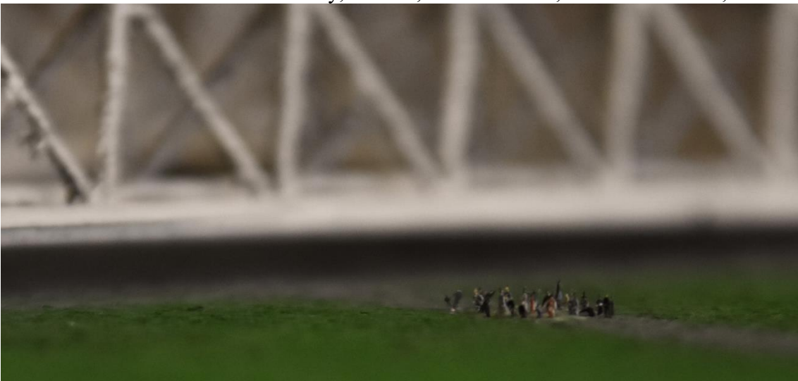
Obr. 2: Model Maeslantské bariéry, detail