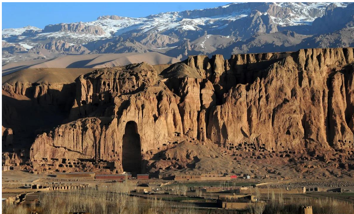
Obr. 4: Bamjánské údolí 2022