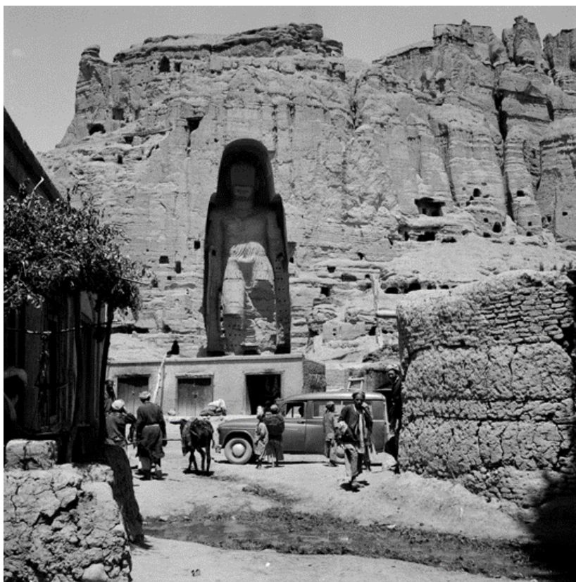
Gesichter Afghanistans Afghanen. Buddha-Figur im Bamiyantal, 1933