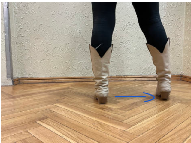
Obr. 17: step touch pravá

7-8 točení se swingovým krokem o další 2/4 (na dvanáctou hodinu), skončíme opět v první taneční pozici