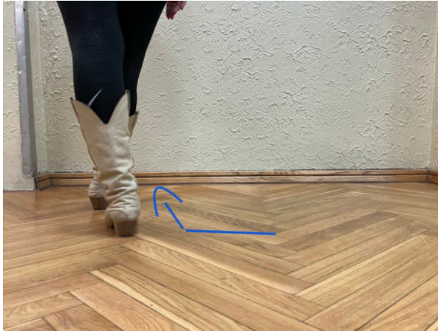
Obr. 21: shufle levá, step rock