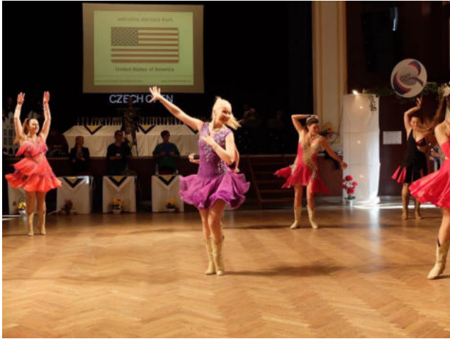
Obr. 5: taneční šaty pro polku či East Coast Swing