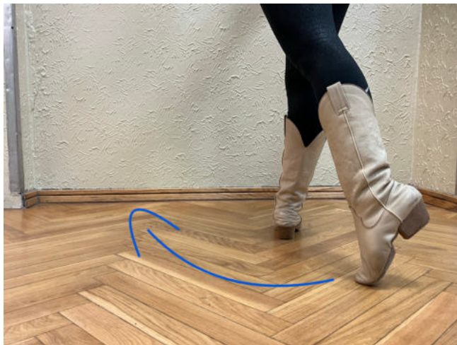
Obr. 11: sweep pravá