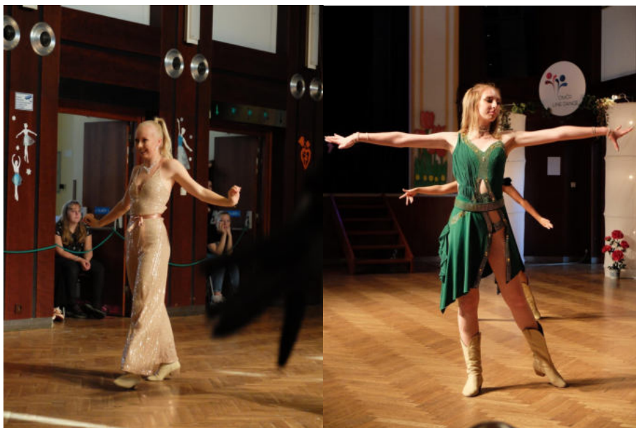
Obr. 2: Overal pro West Coast Swing Obr. 3: taneční šaty pro Night Club

Smooth je obvykle prvním ze soutěžních tanců, který se tancuje na pomalejší pochmurně laděnou píseň. Především se dává důraz na jemné plynulé ladné pohyby, několikanásobné otočky i gymnastické prvky, jako jsou například vysoké švihy nohou. Jeho podskupinami jsou Night Club a West Coast Swing. Tyto tance se tančí ve vysokých kožených botách na podpatku typických pro Line Dance. Nejvhodnějším kostým pro Night Club jsou šikmo střižené šaty s vlajícími ústřižky látky, ale naopak u West Coast Swing je vhodné si obléci společenské kalhoty či dlouhý overal. Night Club vyjadřuje ladnost a velké emoce tanečnicka. Pro tento styl je typické počítání kroků “slow quick quick slow“ (pomalu, rychle, rychle, pomalu). Často se tančí kroky do strany, plynule na sebe navazující, a výrazná práce tělem, která dodává tanci větší dynamiku. Během tance se nesmí tělo nikdy snižovat ani zvyšovat (úroveň hlavy by měla být stabilní). U West Coast Swing jsou velice důležité delší kroky dopředu přes patu. Objevuje se zde výrazná práce s boky a vlnivé pohyby těla. V tomto tanci by měla být vyjádřena jakási smyslnost a atraktivita.