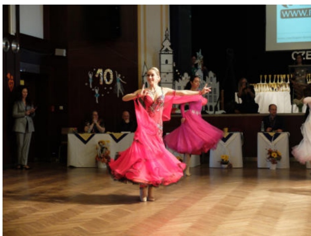
Obr. 4: taneční šaty pro Waltz

Druhý soutěžní tanec je Rise and Fall, tedy Waltz nebo Valčík. Oba tance se tancují na pomalou klasickou hudbu a jsou význačné svojí specifickou a náročnou technikou kroků. Můžeme je technicky přirovnat k Waltzu ve sportovních standartních tancích, pouze se od sebe liší v počítání dob. Waltz se tančí na třicet taktů za minutu, zatímco Valčík na šedesát taktů za minutu. Typické kroky jsou známé svojí délkou – vždy dlouhý, krátký a krátký. Typickým krokem je „twinkle“, krok, kdy se tanečník pohybuje v pomyslných kolejších klikaté čáry a našlapuje na první krok vždy přes patu. Tanečníci opět nosí své vysoké taneční boty typické pro Line Dance a doplňují je zdobnými okáزالými dlouhými šaty s bohatou sukni, jež se dokáže ladně pohupovat v rytmu tanečníka.