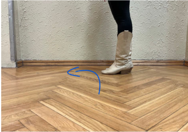
Obr. 23: step turn, thump, sway

Obr. 7-21: prvky taneční choreografie (Autor: Alžběta Nováková)