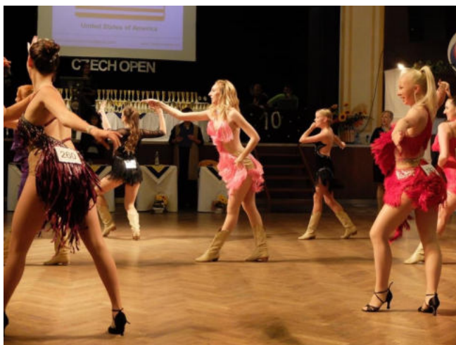
Obr. 6: taneční šaty na Cha Cha

Znamé počítání “raz, dva, tři, cha cha cha“ je takovým typickým prvkem pro styl Cuban. Bez jakéhokoliv zaváhání bychom mohli přirovnat styl Cuban ve sportovních latinskoamerických tancích ke stylu Cha Cha či k Sambě. Důležitou technikou je vytáčení boků a svižné výměny kroků. Váha těla je po celou dobu tance vepředu, tedy před středovou osou těla. Pohyby rukou jsou ostré a švihané. Zde si tanečníci mohou dovolit nosit boty s jemnými pásky a s vysokým podpatkem čili latinky. Obvyklým kostýmem jsou krátké bohatě zdobené šaty třásněmi, které se krásně hýbou a dodávají pohybům větší efekt.