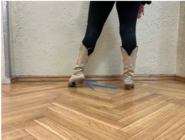
Obr. 14: out