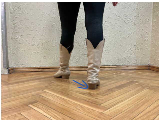
Obr. 15: in