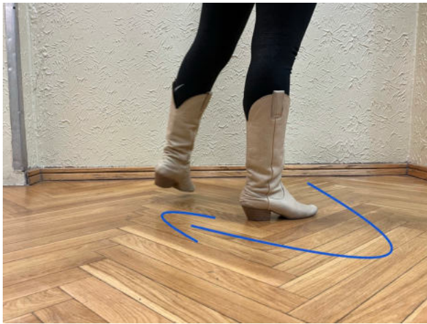
Obr. 19: turn 4/4