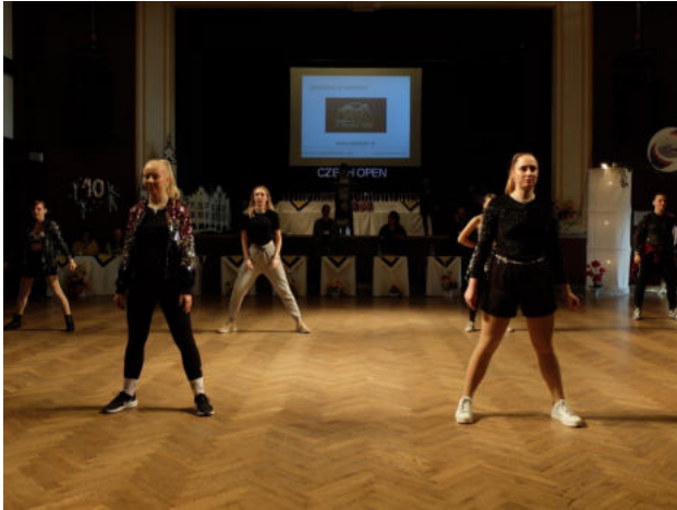
Obr. 7: různorodé kostýmy pro taneční styl Funky