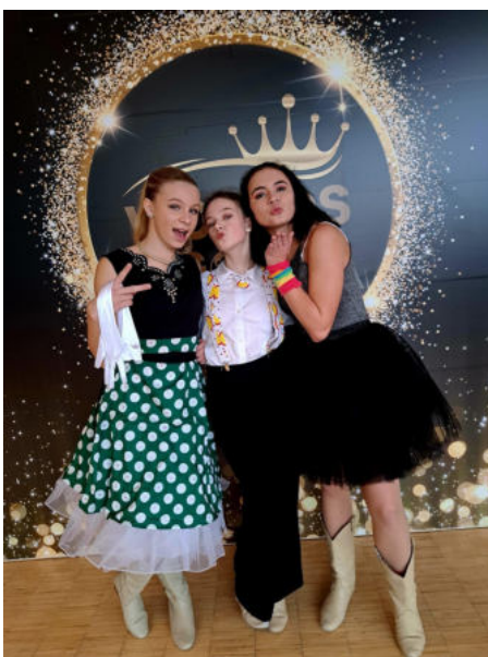
Obr. 8: různorodé kostýmy pro taneční styl Novelty

Novelty je třetím soutěžním tancem ve skupině Line Dance – Open. Můžeme si ho přirovnat k muzikálovým tancům. Porotci nejenže soudí techniku kroků, ale především hodnotí taneční, ale i herecký výkon a divadelní prvky během vystoupení soutěžícího. Hudba se často vybírá ze známých filmů, vtipných ústřížků či hudba se scénickými elementy. V této skupině se taneční styly prolínají mezi sebou. Výběr obuvi tanečnicků je zde naprosto neomezený. Kostým je volen dle hudby a tématu tance, pouze s omezením, kdy kostým nesmí tanečnicka svazovat v pohybu. Tanečník by zde měl projevit svoje kreativní nápady a na parketě by to měla být jedna velká show. [4] [8]