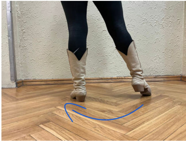
Obr. 10: step levá