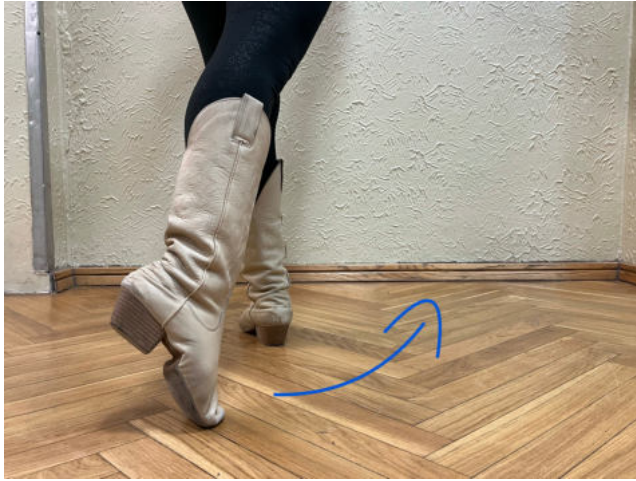
Obr. 12: step pravá