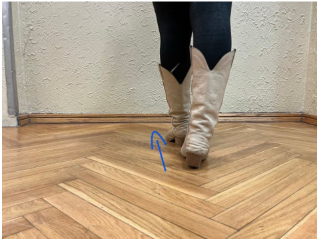
Obr. 22: step, step

7-8 obě nohy jsou u sebe, tedy v první taneční pozici, kolena jsou povolena (ne zcela dopnutá) a boky se pohybují do pomyslné osmičky ze strany na stranu, nejprve doprava, poté doleva, přitom obě ruce švihem dostaneme nad hlavu a máváme s nimi ze strany na stranu