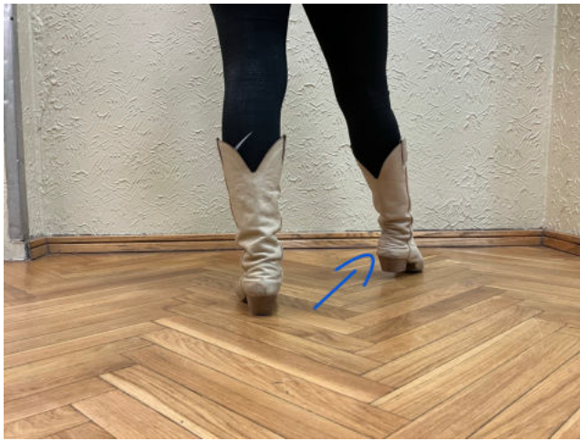
Obr. 13: out