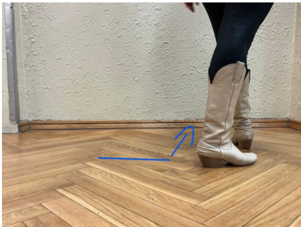
Obr. 20.: shufle pravá, step rock

7&-8 nášlap levou nohou dopředu s osmdesáti procenty váhy těla