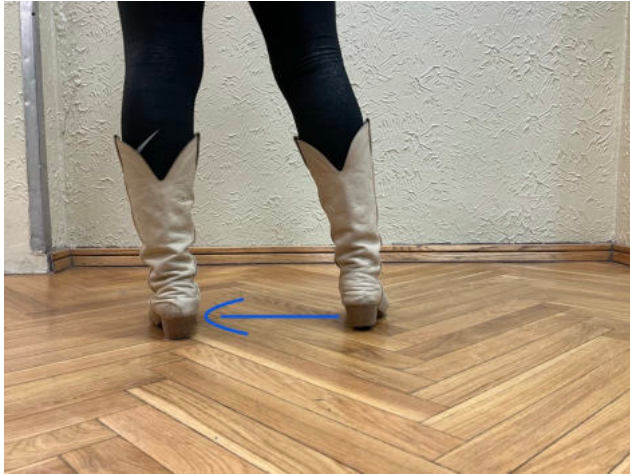
Obr. 18: step touch levá