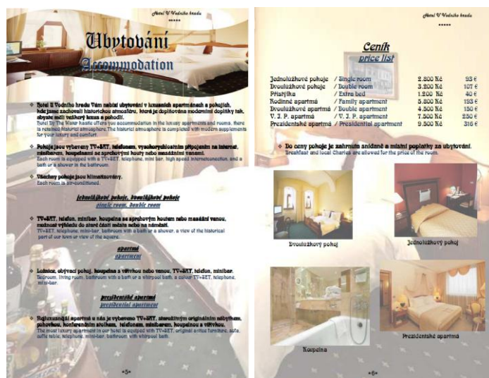
Obr. 1. Ukázka listů z katalogu

Katalog je sestavený ze služeb hotelu, které jsme považovali za základní nabídku pětihvězdičkového hotelu.