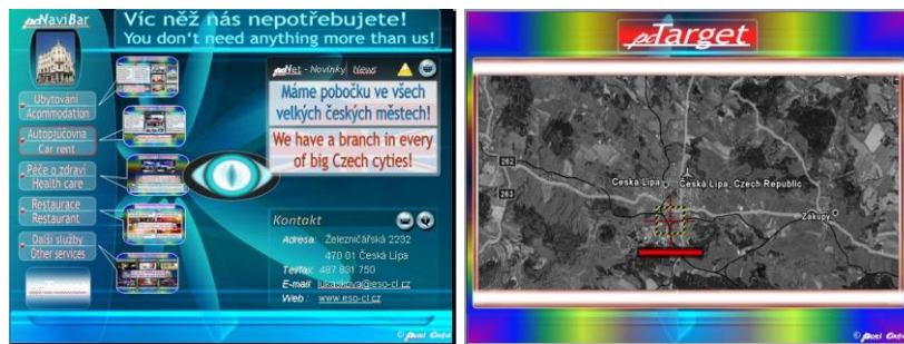
Obr. 2. Ukázka z prezentace

Videospot je zaměřený na upoutání pozornosti návštěvníka na hromadných výstavních akcích. Je vytvořený pro promítání na 15. Mezinárodním veletrhu fiktivních firem v Praze 2009. Podmínkou zadavatele je délka díla 20 s a určený jednotný jazyk průvodního textu (anglický jazyk).