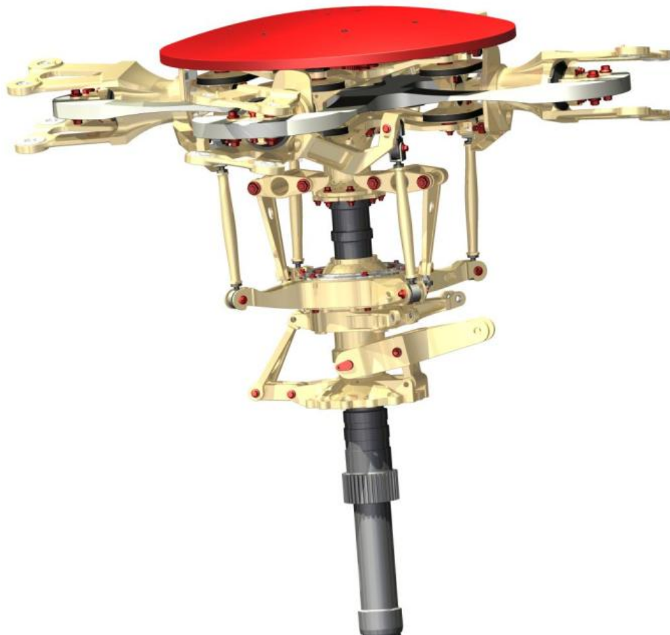
Obr. 4: celkový pohled