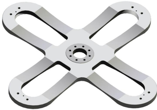
Obr. 2: jařmo