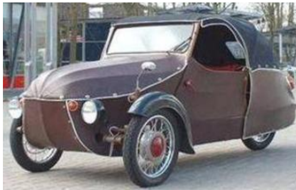
Obr. 1: Velorex 16/350

Lidé vždy s úžasem sledovali stará vozidla- veterány. Nejen klasické veterány, ale i tříkolku potaženou plátnem se zvukem jako motorka- Velorex. České lidové vozítko nenáročné na údržbu, provoz a velmi snadno opravitelné. Autor byl již při své první jízdě Velorexem fascinován, pořídil si ho a dnes restauruje.