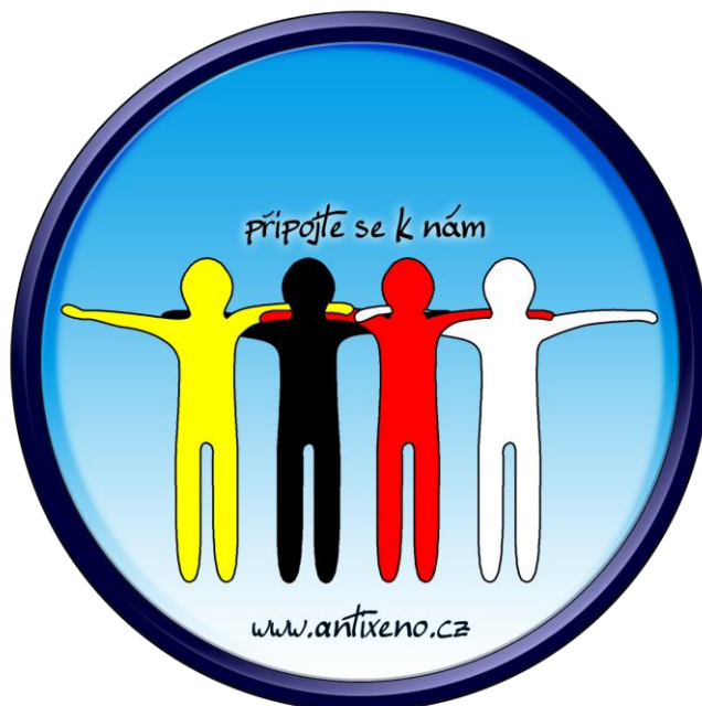
Obrázek 1 - Antixeno logo