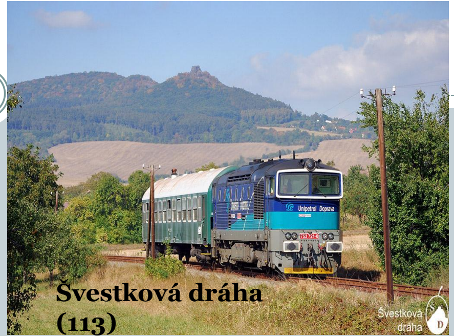
Švestková dráha (113)