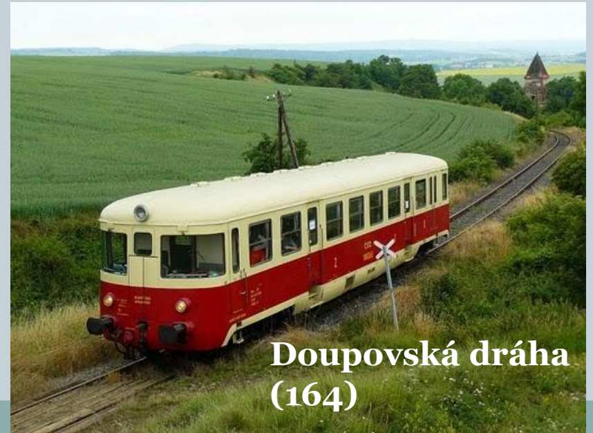
Doupovská dráha (164)