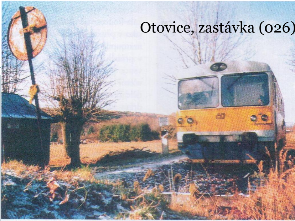
Otovice, zastávka (026)