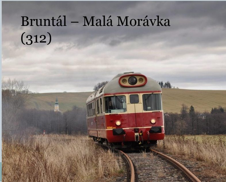
Bruntál – Malá Morávka (312)