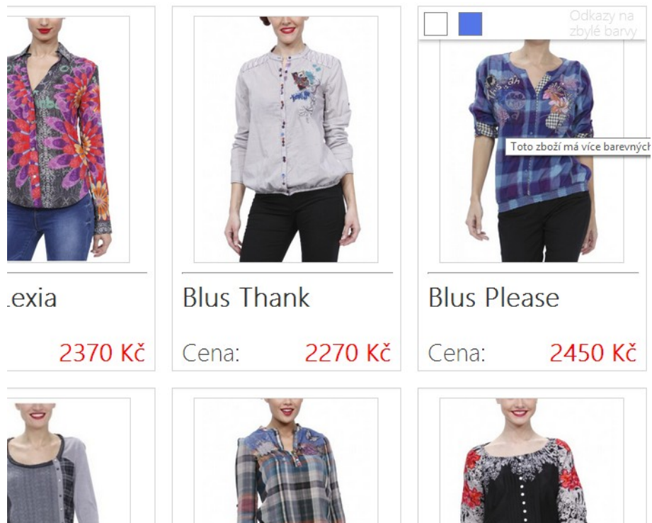
Obr. 1: design části e-shopu