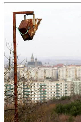
Obr. č. 4