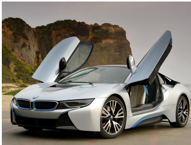
Obr. 4: BMW i8