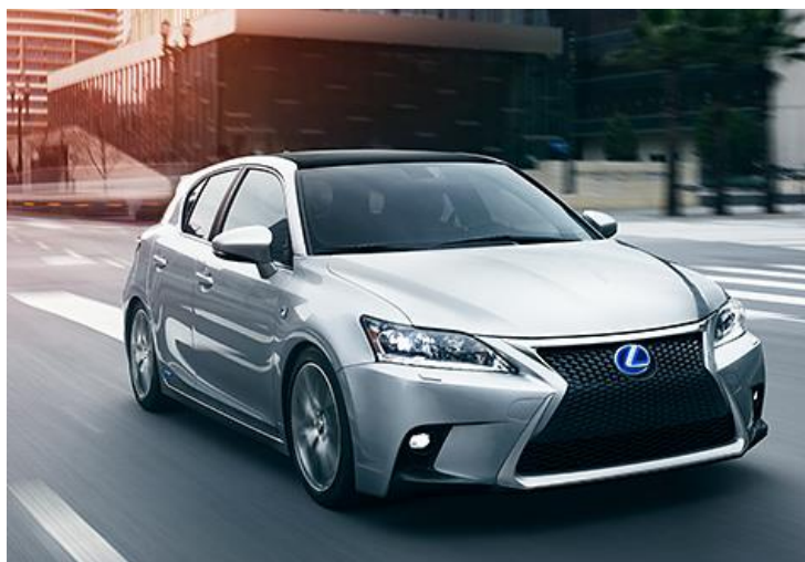
Obr. 3: Lexus CT 200h

Celková průměrná spotřeba za celou dobu testu byla velmi dobrých 5,51 l/100 km na 788 km. To vše si ale samozřejmě vybírá svou cenu. Auto není ani ve sportovním módu schopné akcelerace, na kterou jsme zvyklí z benzinových/diesellových kompakťů typu BMW řady 1, Audi A3 nebo Volvo C30. Jednoduše řečeno, je líné. Ale je to špatně?