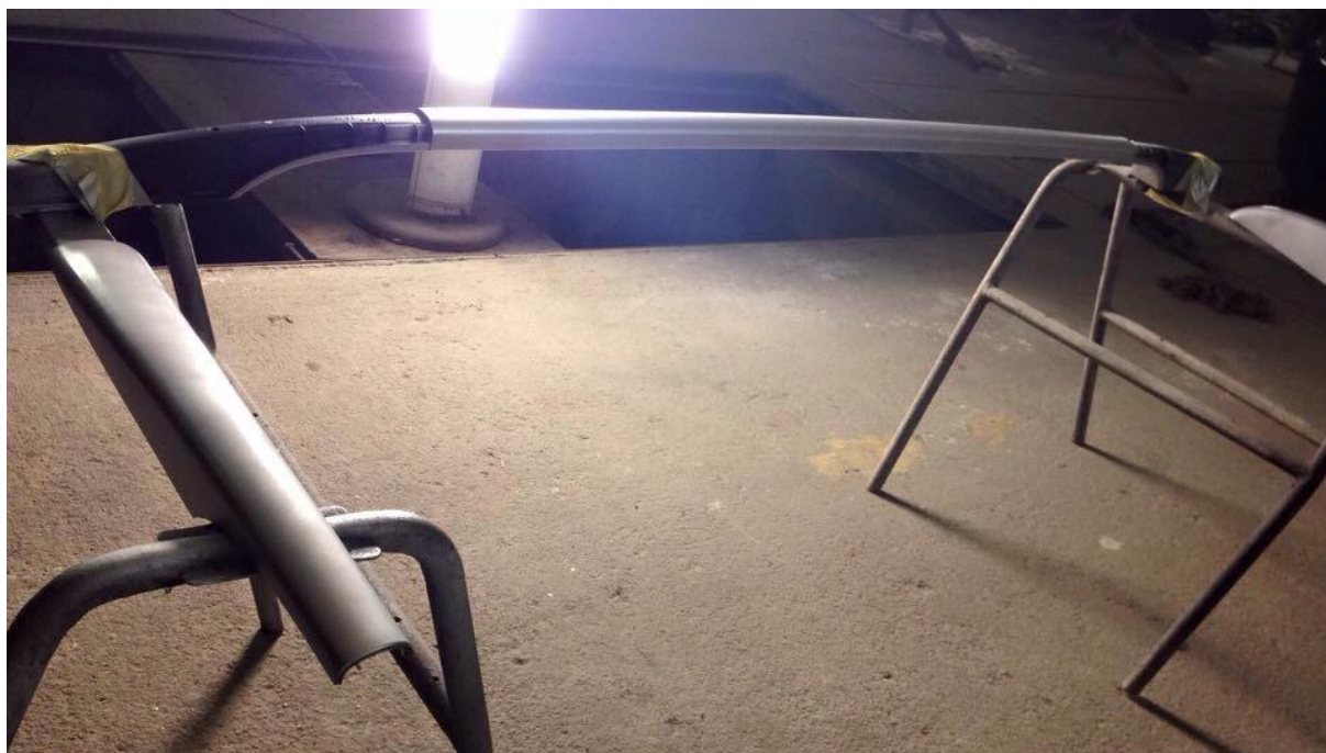
Obr. 1: Střešní lišta - moje práce

Pojem hybrid, chcete-li hybridní motor, slychávám poměrně často, ale nikdy jsem si pod tím neuměla představit jasné údaje a skutečnosti. Také z tohoto důvodu jsem si toto téma pro mou práci zvolila.