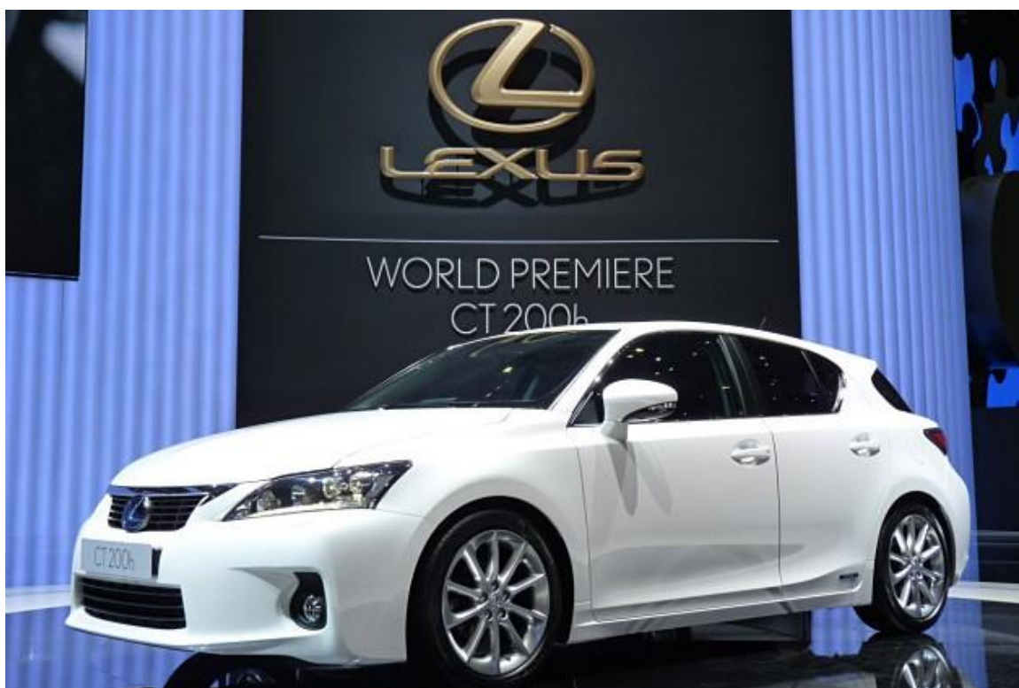
Obr. 2: Vystavený Lexus CT 200h při jeho premiéře

Hybridní kompakt Lexus CT 200h budil pozornost od chvíle, kdy jej Toyota poprvé představila na autosalonu v Ženevě.