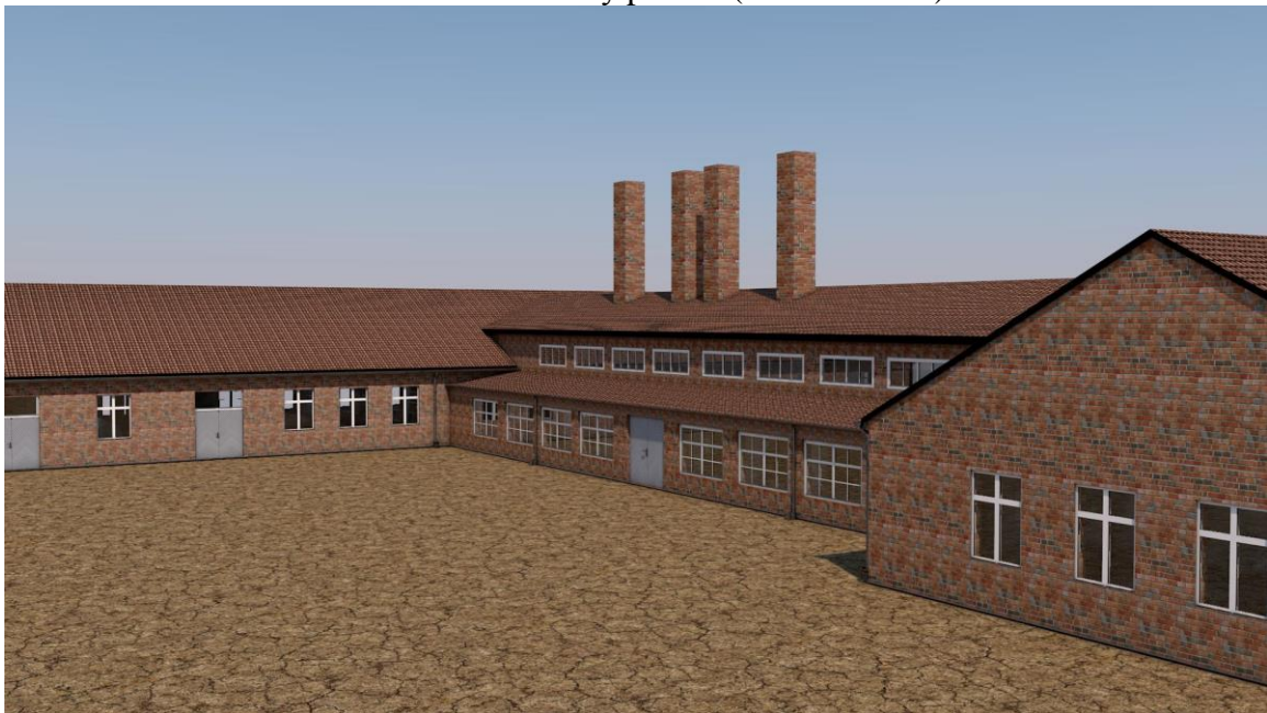
Obr. 4: Sauna (Auschwitz II.)