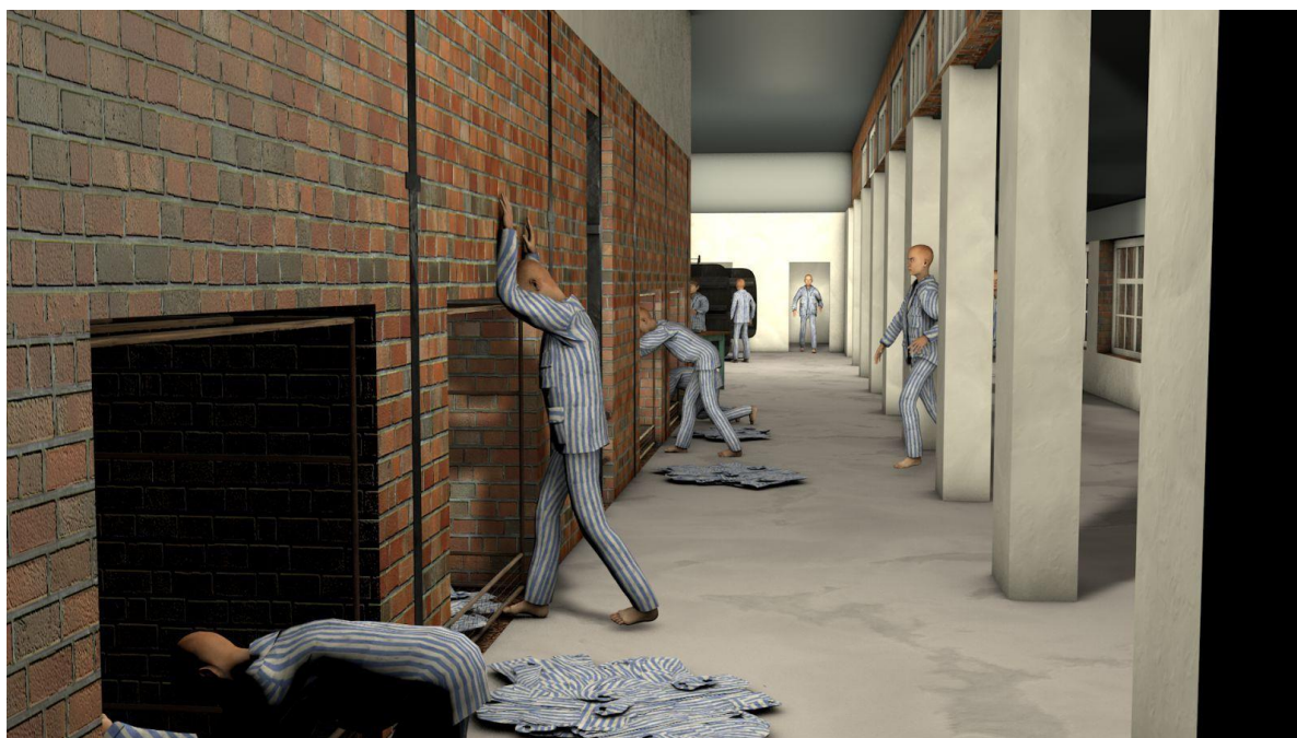
Obr. 5: Sterilizace oděvů (Auschwitz II.)