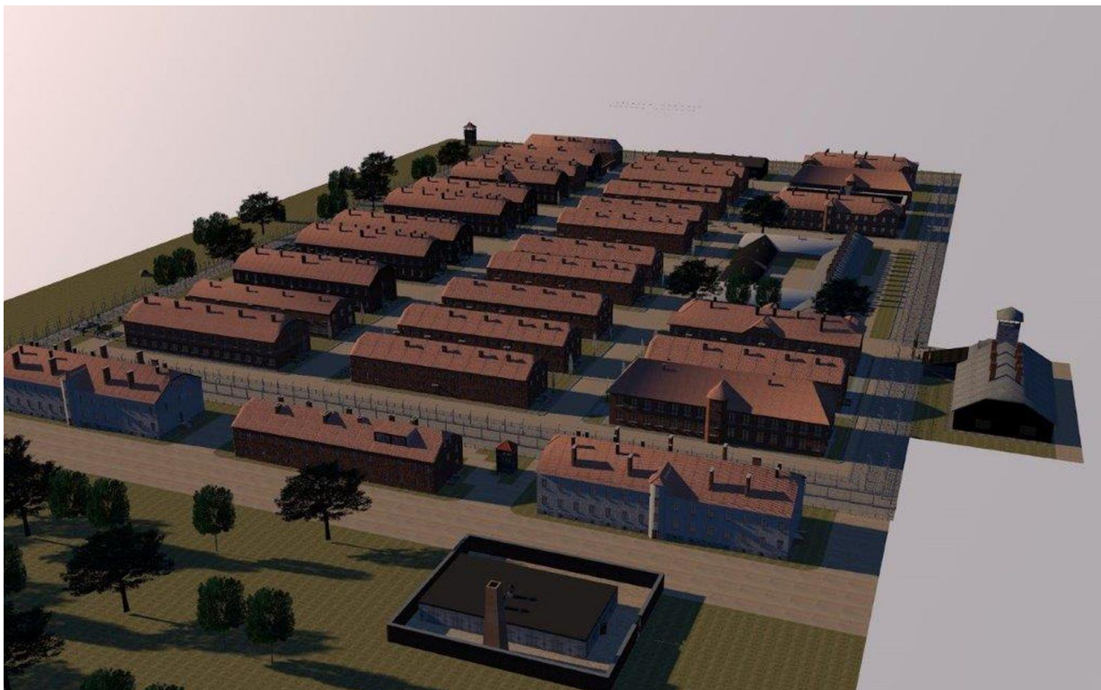
Obr. 2: Celkový pohled (Auschwitz I.)