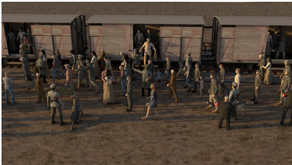
Obr. 5: Příjezd transportu (Auschwitz II.)