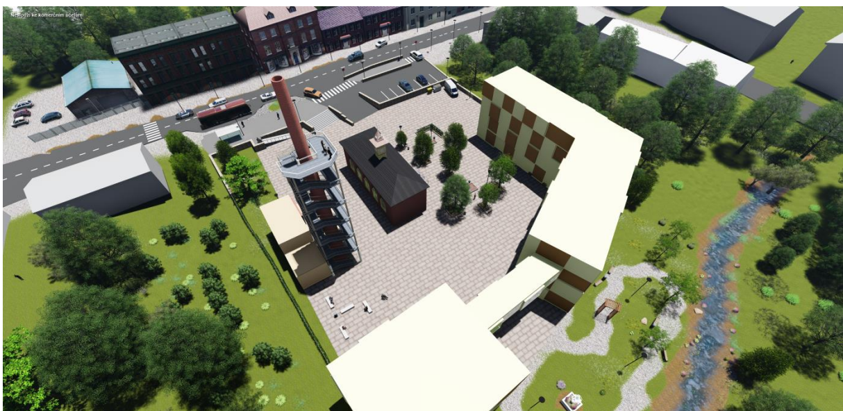
Obrázek č. 8: Vizualizace areálu z ptačí perspektivy