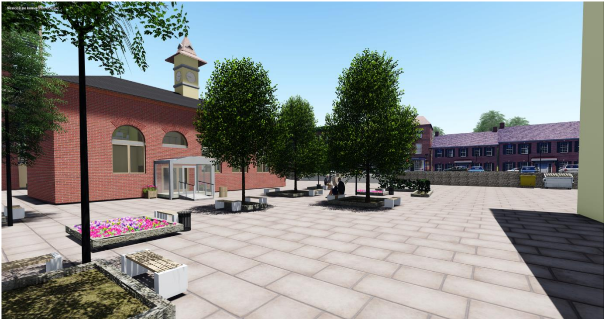
Obrázek č. 7: Vizualizace prostoru náměstí

V okolí budovy počítáme s pojízdným chodníkem z důvodů zásobování, přepravy osob eventuálně zásahu složek IZS, dále se zde nachází malé náměstí se zelení. Prostor mezi Malým Labským náhonem a Pražskou třídou dělí budovy domova pro seniory a kaskáda vyrovnávající výškový rozdíl schodiště. U hlavní cesty je vybudována nová zastávka MHD a v kaskádě jsou vytvořeny schody vedoucí na pojízdný chodník. V kaskádě se také nachází rampa pro hendikepované za zastávkou MHD a sjezd pro vozidla. V bezpečné vzdálenosti od zastávky leží parkoviště pro návštěvníky a od hlavní cesty je odděleno ostrůvkem. Kaskáda vyrovnává výškový rozdíl činicí cca 1,5 metru. Prostor mezi kaskádou a Malým Labským náhonem dělí budovy domova pro seniory z varianty Špalíček, objekt se skládá ze dvou budov spojených průchodem. Mezi domovem pro seniory a Malým Labským náhonem leží zeleň zkrášlující okolí vodní plochy a komunikace na relaxační procházky.