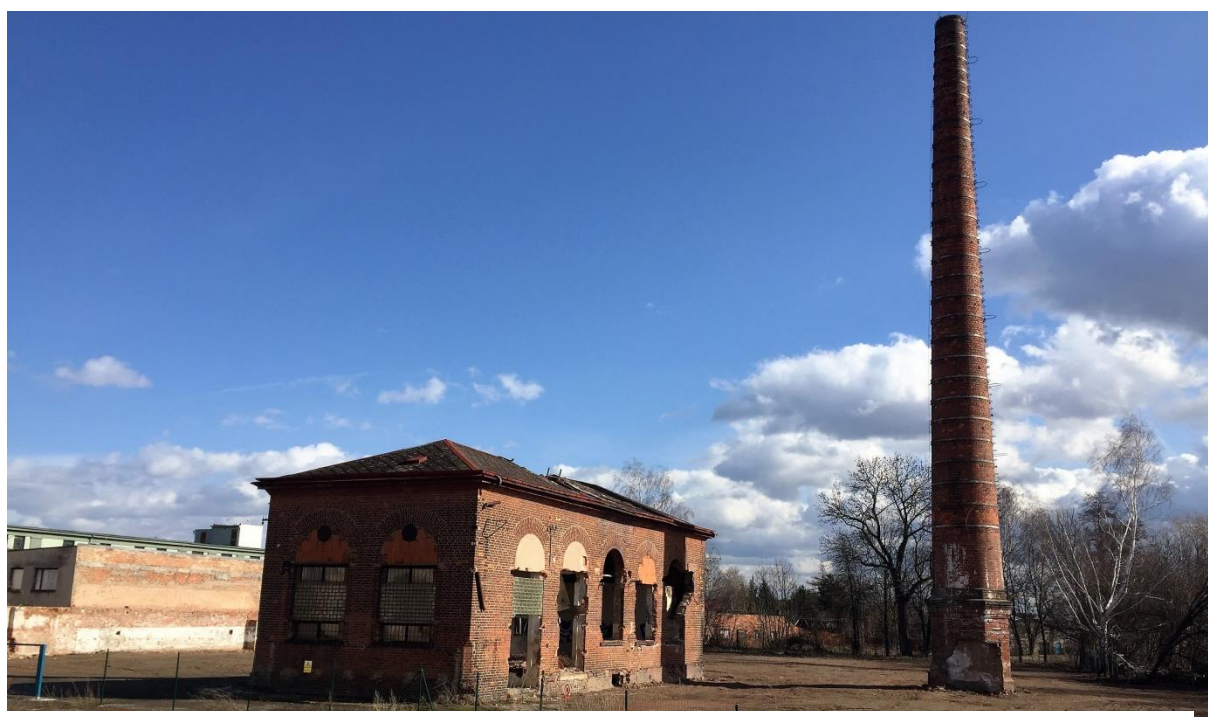
Obrázek č. 5: Aktuální fotografie stavu budovy