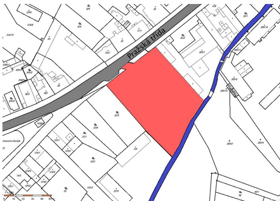
Obrázek č. 2: Zakreslení areálu do katastrální mapy

Areál se nachází v městské části Kukleny, která leží na jižním okraji města Hradec Králové. Řešený areál leží mezi Pražskou třídou a Malým Labským náhonem. V okolí se nachází menší průmyslový areál, plocha zeleně a Anenské náměstí. Okolní zástavbu tvoří zejména 3-4 podlažní bytové domy. Hlavní cesta procházející Anenskou třídou vede do centra města. Díky sousedící hlavní cestě je k objektu dobrý přístup dopravními prostředky. V nedalekém okolí se nachází nově vybudovaný obchodní dům Aupark, v jehož těsné blízkosti leží vlakové nádraží.