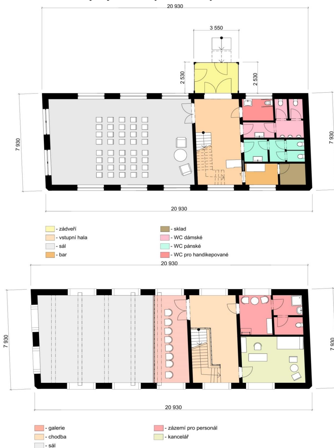
Obrázek č. 6: Půdorys 1NP a 2NP

Dispozici bývalého administrativního objektu jsem navrhl jako sál procházející oběma patry se zázemím v podobě toalet, malého koutku s občerstvením a skladem v prvním patře a kanceláří, zázemím pro zaměstnance, chodbou a galerií v patře druhém. Galerie zasahuje do prostoru sálu a zvyšuje jeho kapacitu, která činí cca 80 osob. V celém objektu byl kladen důraz na zachování venkovního historického vzhledu a současně na jednoduchý a nenákladný systém vnitřní dispozice. Do objektu je v návrhu vloženo ocelové patro ukotvené mezi obvodové nosné stěny, patro zasahuje do cca 1/2 celkové délky budovy. Prostor toalet, skladu a koutu s občerstvením je od sebe oddělen příčkami. Veškeré technické zařízení budovy kromě elektrických rozvodů se nachází pouze v 2/5 budovy, což by při realizaci snížilo náklady na práci a materiál. K budově je přistavěno nenápadné prosklené zádveří s rampou pro hendikepované a vstupními dveřmi.