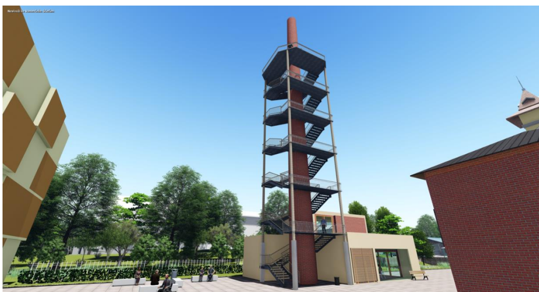
Obrázek č. 10: Vizualizace pohledu na komín