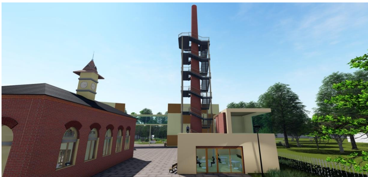
Obrázek č. 9: Vizualizace pohledu na komín

Rozhledna by se měla stát dominantou celého areálu a společně s osvětlením by měla v noci zkrášlit celkový pohled na noční Kukleny. Hlavními návštěvníky rozhledny by se měli stát návštěvníci přicházející za klienty domova pro seniory, například vnoučata s rodiči po návštěvě prarodičů. Výstup do jednoho z šesti pater by se mohl stát součástí rehabilitace seniorů. Z prvopočátku rozporupná myšlenka rozhledny v areálu domova pro seniory se mi jeví jako velice originální. Ojedinelé využití továrního komínu k rehabilitačním účelům by mělo vést k posouváním vlastních možností seniorů a zlepšování nejen jejich fyzické, ale i psychické kondice.