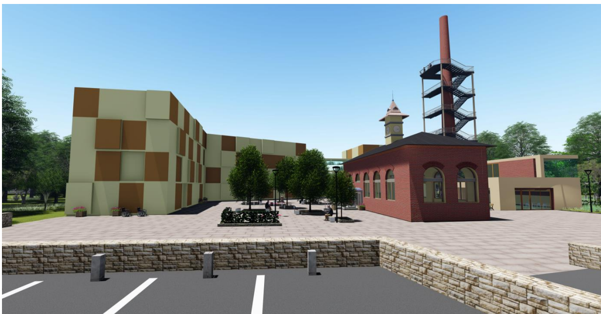
Obrázek č. 1: Vizualizace areálu

Mým úkolem bylo navrhnout centrální prostor (náměstí) čtvrtě Kukleny na místě bývalé koželužny, jehož součástí bude společensko-kulturní zařízení, přičemž má být zachována jeho historicko-umělecká hodnota. Z administrativní budovy má vzniknout společenské zařízení.