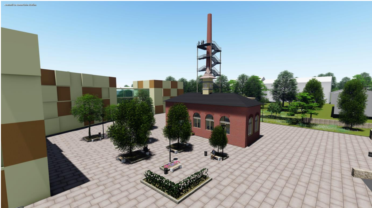
Obrázek č. 11: Vizualizace pohledu na náměstí

Při řešení areálu jsem navrhl kompozici náměstí a parteru v okolí domova pro seniory. Věřím, že náměstí bude plně vyhovovat jeho potřebám a splní přání magistrátu na obnovu městské části Kukleny. Doufám, že návrh rozhledny vystavěné okolo bývalého továrního komínu nabídne nový pohled na využití mnoha těchto staveb, které po ukončení provozu chátrají a „čekají“ na demolici i přes jejich hodnotu jak historickou, tak hodnotu pro celkový ráz krajiny, ve kterém tvoří dominantu. Řešení má mít minimální finanční nároky. Při rekonstrukci bývalé administrativní budovy jsem mezi obvodové stěny vložil ocelovou konstrukci vytvářející dostatek prostorů pro potřeby plánovaného využití bez zbytečně složitě řešení. Okolí domova pro seniory nabízí dostatečné množství prostoru, zeleně a společně s pojízdným chodníkem vytváří ideální využití prostoru dle požadavků zadání magistrátu města Hradec Králové. Projekt může nabídnout magistrátu možnost kompozice okolí domova pro seniory a může inspirovat v dalším nakládání s areálem.