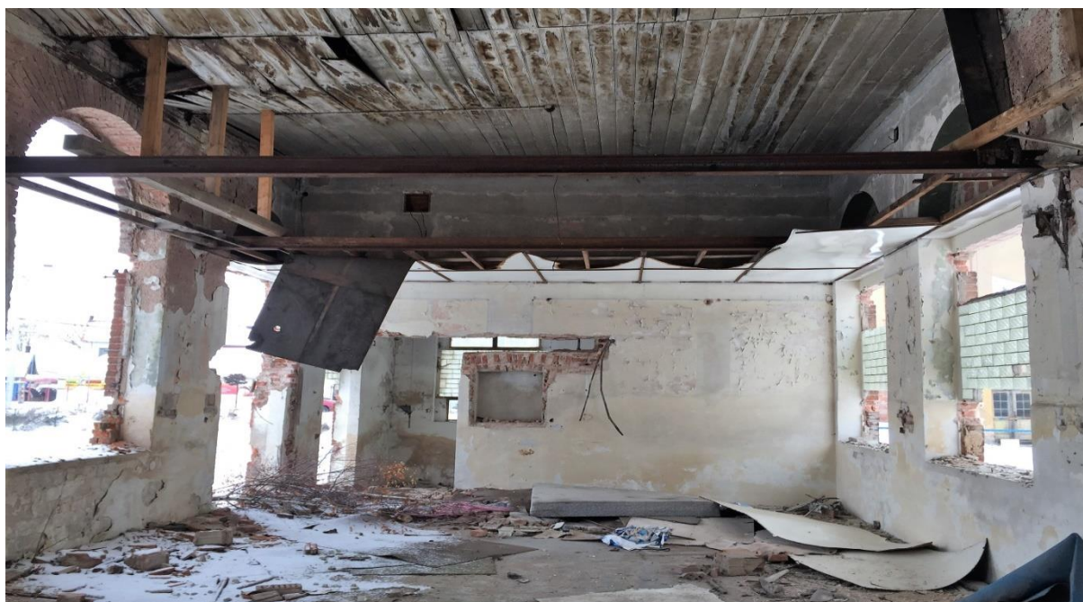
Obrázek č. 4: Aktuální fotografie stavu budovy

V současnosti po demolici je zachována pouze bývalá administrativní budova, bytový dům a komín, při demolici byla zachráněna věžička, která byla odvezena, nyní je uskladněna ve skladu technických služeb na královéhradeckém letišti. Administrativní budova je v havarijním stavu, strop se propadá a dřevěné nosníky pomalu prohívají. Pro zachování obvodové nosné konstrukce z režného zdiva (šířka 550 mm) by stačila drobná údržba. Střecha je po odstranění věžičky nevhodná a její oprava neekonomická. Bytový dům přestává být vyhovující, a pokud má být komín zachován, vyžaduje drobné opravy.