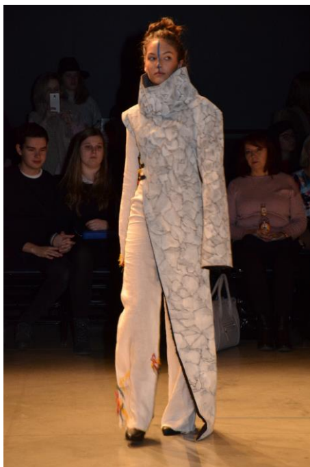
Obr. 5 Model z kolekce BIOMY - Tundra