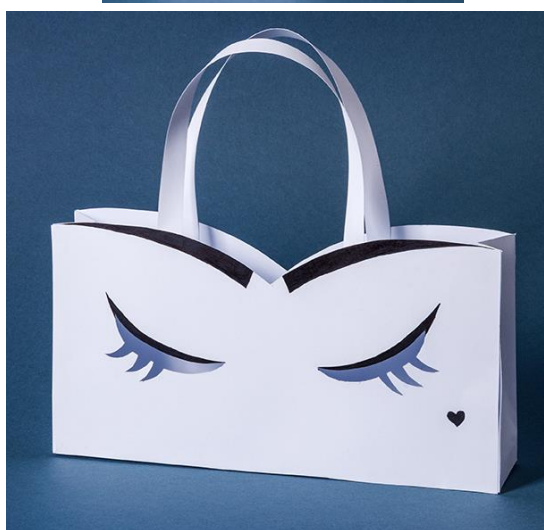
Obr. 1: ateliér módních doplňků