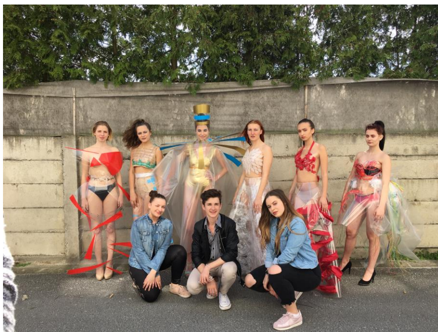
Obr. 3: Kolekce Kdo jsem já? prezentovaná v rámci soutěže Avantgarda 2018 v Lysé nad Labem