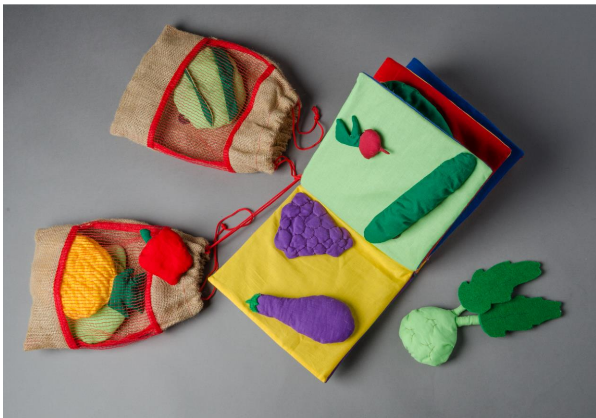
Obr. 89 Didaktické pomůcky pro děti s poruchami učení