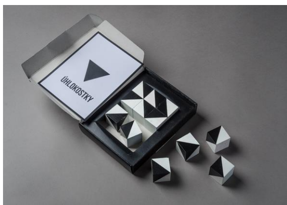
Obr. 7 Dětská hračka - úhlokostky