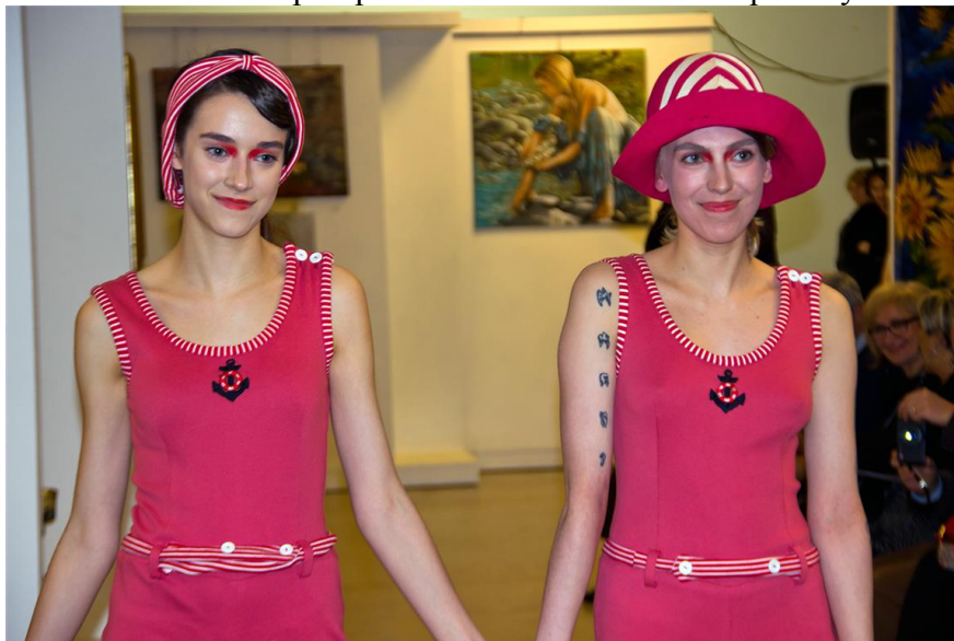
Obr. 3: Dobové oděvy 1. republiky

U příležitosti 100.výročí vzniku Československa vytvořili studenti VOŠON oděvní kolekci, při které zvolili různé historické inspirační zdroje. Jednalo se např. o českou kulturu, dovednost českých lidí, barevnost české vlajky, ale také o klasické řemeslo ve zpracování výšivek a korálkového zdobení. Modely vznikly ve spolupráci s českými firmami Preciosa – výrobce korálků, J. Danzinger - modrotisk a Velveta Varnsdorf - vlněné materiály. Jako doplňky k modelům byly použity klobouky firmy Tonak. Tuto kolekci předvedli studenti na módní přehlídce ve Florencii ve spolupráci s konzulátem České republiky.