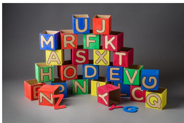
Obr. 8 Dětská hračka – učební pomůcka