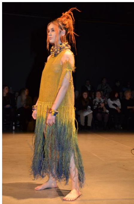
Obr. 6 Model z kolekce BIOMY – Deštný prales