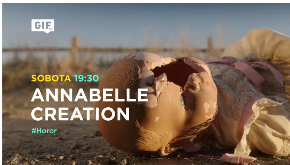
Obr. 4: Line-up

Druhou částí maturitní práce bylo vytvoření on-air grafiky. S pomocí programu Adobe After Effects autor vytvořil kompletně všechny práce a to: Ident ID, Bumper, Promo, Line-up, Logo bug + Snipe a Up-fronts. Při této tvorbě byl kladen důraz na přesnost-správné nastavení času, dodržení grafického stylu a předepsaných pravidel. Dále autor spolupracoval s programy Adobe Illustrator, Photoshop a Premiere Pro.