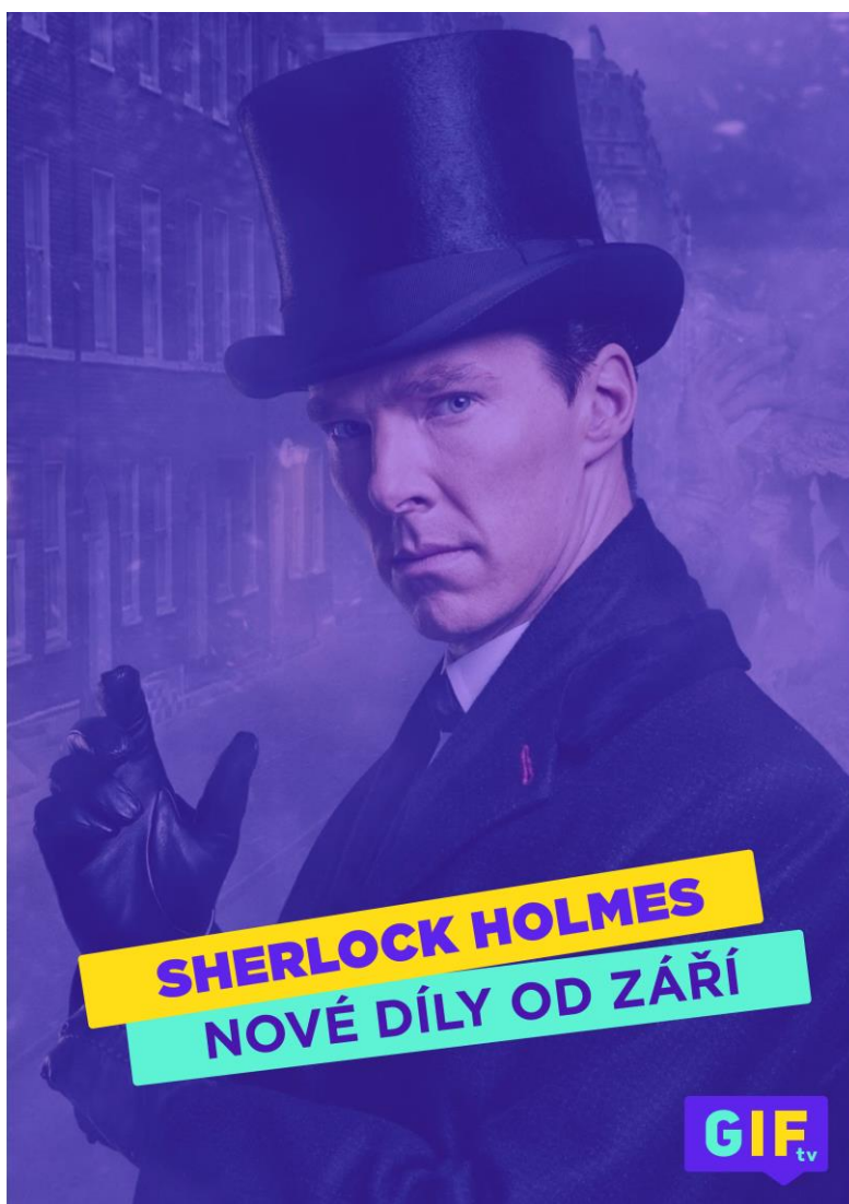
Obr. 3: plakát