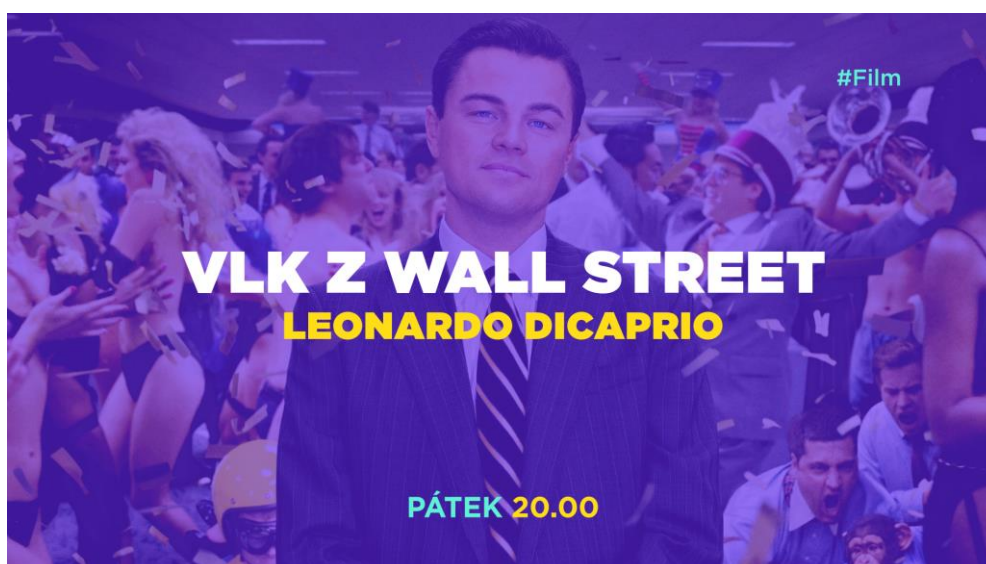
Obr. 5: Promo