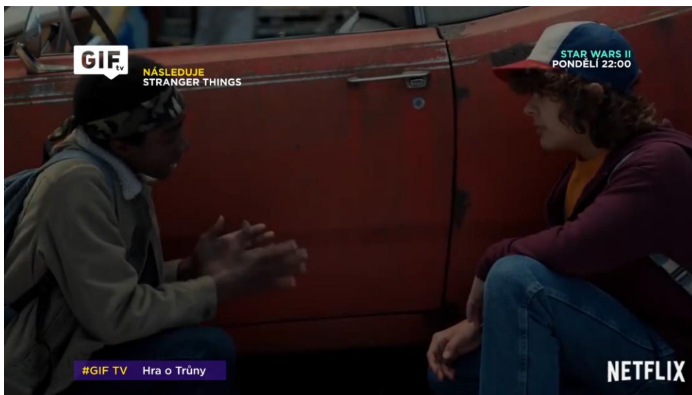
Obr. 6: Snipe a Logo-bug