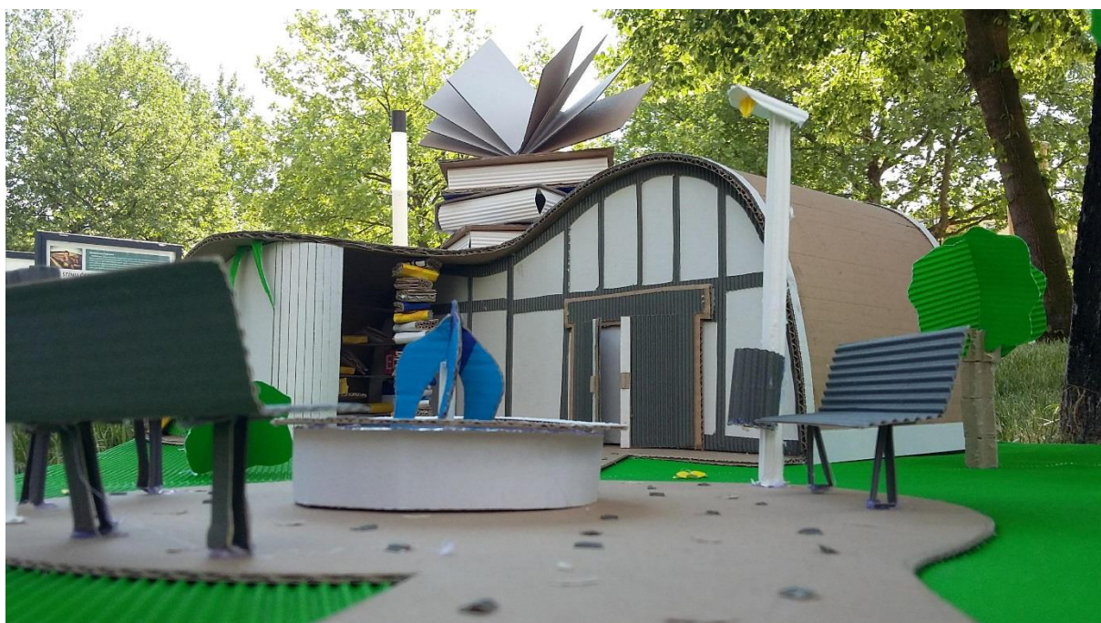
Obr. 2 Detailní fotografie modelu z čelní strany