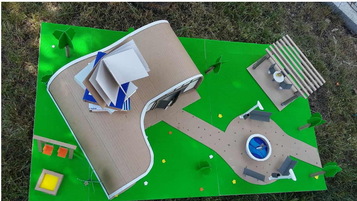
Obr. 4 Model při pohledu z výšky