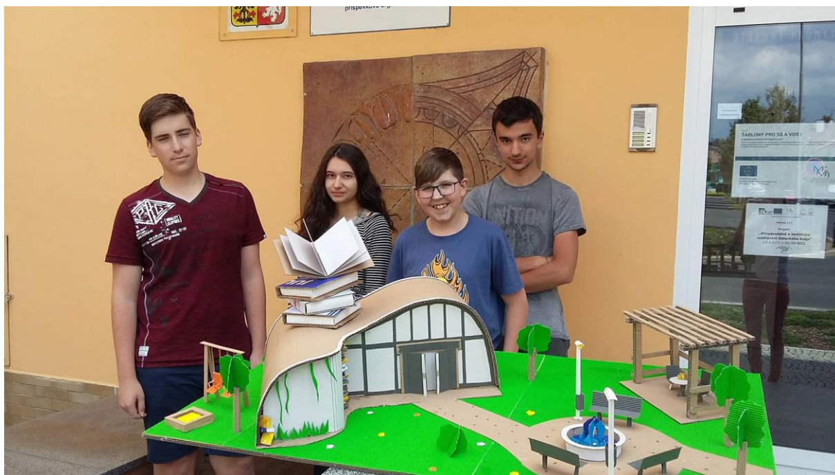
Obr. 1 Skupina stavitelů vyfotografována se svým projektem knihovna Bookland